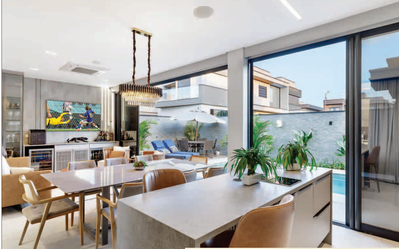
Este receiver (na parte inferior do móvel) alimenta as caixas do espaço gourmet, da piscina e da sauna.